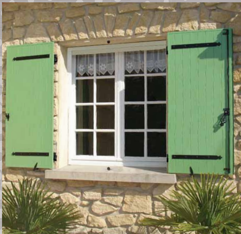
Volet battant isolé 2 vantaux Montage Pentures / contre-pentures