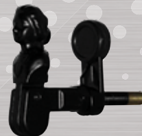
Tête de Bergère