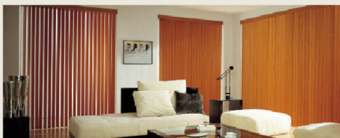
▲ Vertitop avec lames en textile, une décoration harmonieuse.