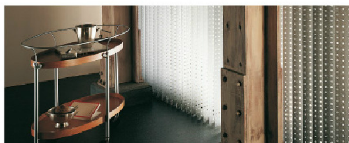
▲ Vertitop avec lames micro perforées : efficace pour laisser entrer la lumière tout en préservant l'intimité.