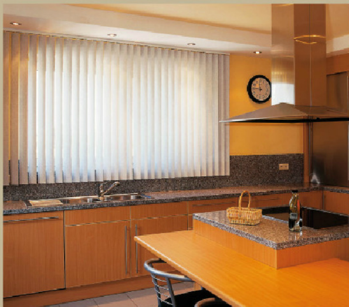
▲ Vertitop avec lames en vinyl, une idée déco pour la cuisine.